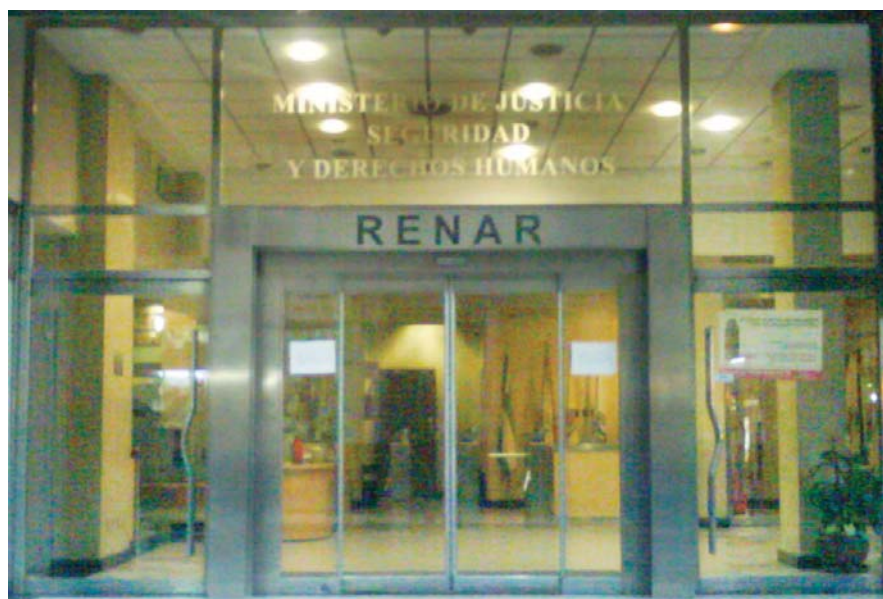
HALL DE ACCESO AL NUEVO EDIFICIO DE LA SEDE CENTRAL DEL RENAR SITA EN BME. MITRE 1469 CAPITAL, ADQUIRIDA CON FONDOS PROPIOS DERIVADOS DE LA APLICACION DE LA LEY 23.979.

El material de resistencia balística satisface los requerimientos de la Norma MA.02, cuando la probeta de ensayo iguala o supera las especificaciones de la tabla N°1.